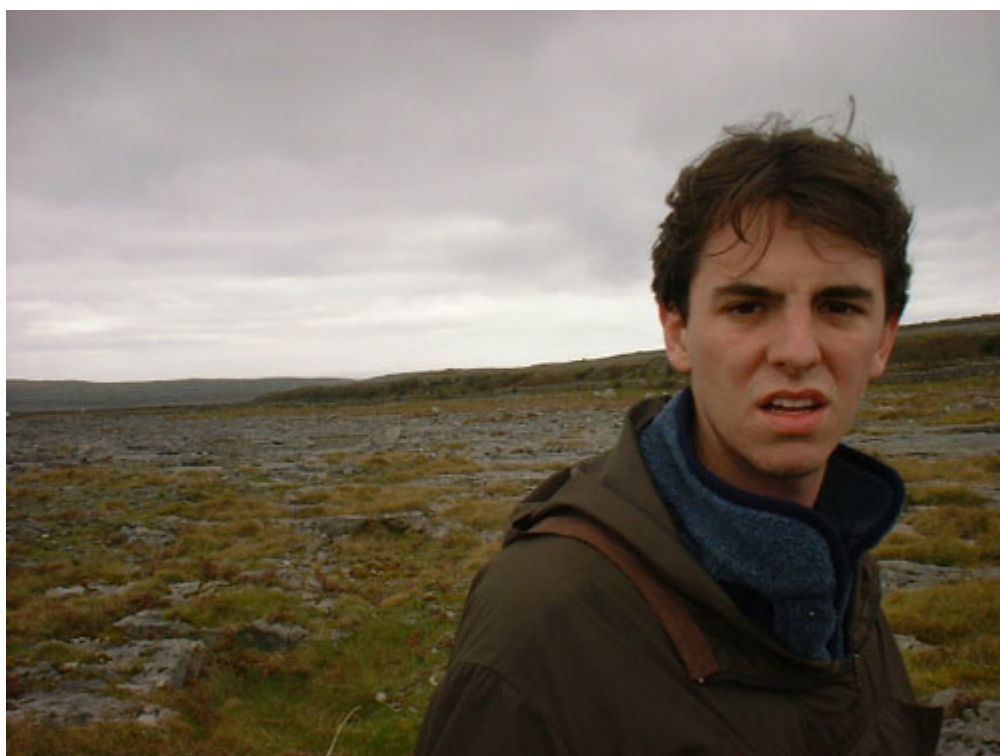
En bicicleta por las Aran