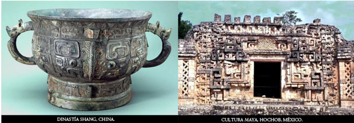
DINASTÍA SHANG, CHINA.